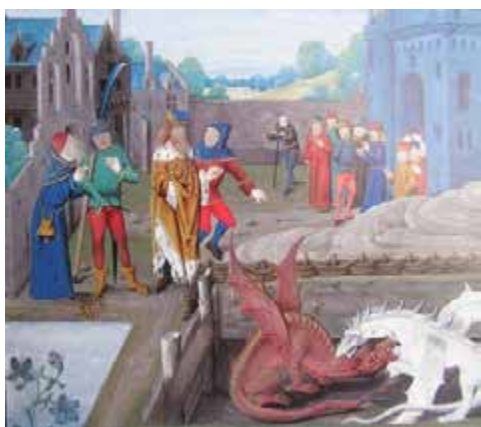
Miniature du manuscrit de La Chronique de St-Albans , XV e siècle (Londres)

Lors du concert scolaire du jeudi 7 mars 2019 sera entre autre interprétée par le groupe traditionnel gallois Calan et l'OSB la chanson Tale of two dragons .