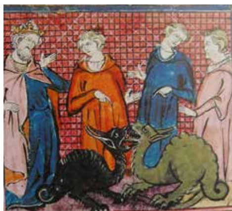
Manuscrit français du XIV e s. (Paris, BnF)

Le dragon a été le symbole des rois britanniques depuis des époques mythiques. Les Mabinogions, épopées du pays de Galles, racontent l'histoire du combat pour le contrôle de la Grande-Bretagne entre le dragon rouge et un envahisseur dragon blanc: symbole du combat entre les Celtes et les Saxons.